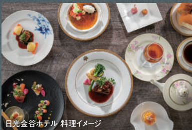
日光金谷ホテル 料理イメージ