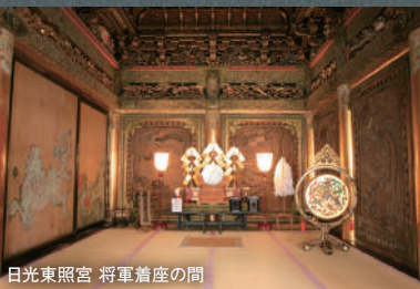
日光東照宮 将軍着座の間