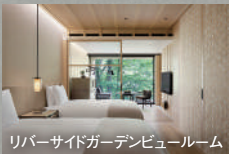
リバーサイドガーデンビュールーム

※ガストロノミーレストラン「レックハウス」での 夕食をご希望の場合は予約時にご相談ください。