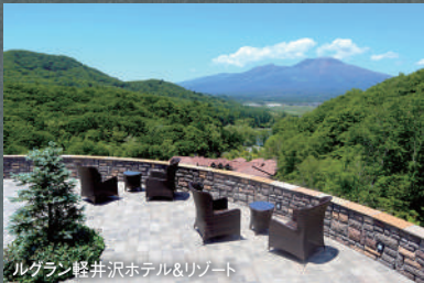
ルグラン軽井沢ホテル&リゾート