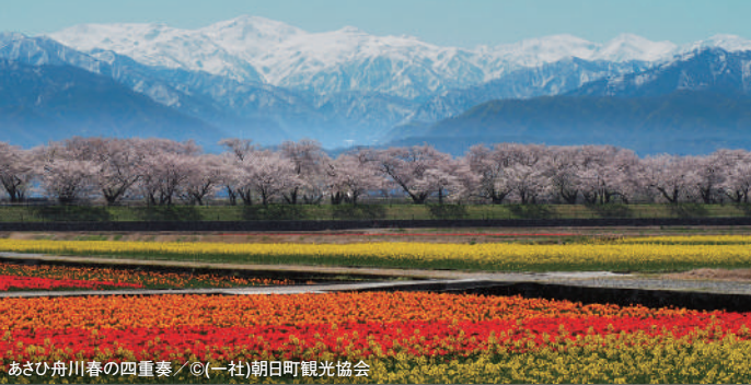
あさひ舟川春の四重奏