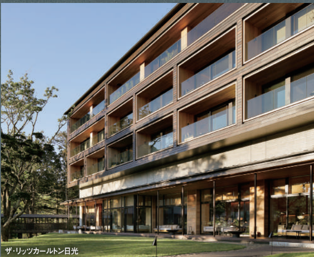
ザ・リッツカールトン日光