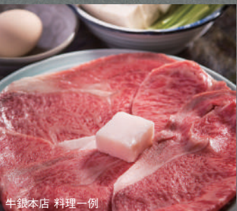
牛銀本店 料理一例