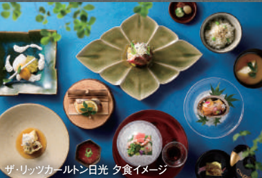
ザ・リッツカールトン日光 夕食イメージ