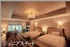
ジュニアスイート

お食事:〈夕食〉フレンチフルコース(レストラン) 〈朝食〉洋食ビュッフェ(レストラン)