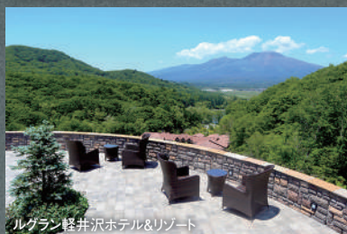
ルグラン軽井沢ホテル&リゾート