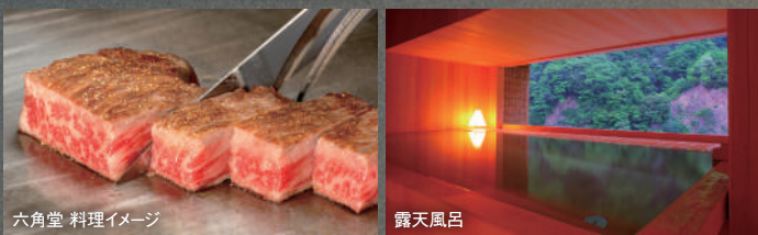
六角堂 料理イメージ