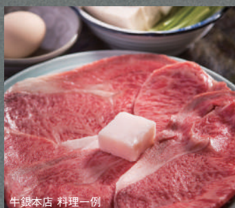
牛銀本店 料理一例