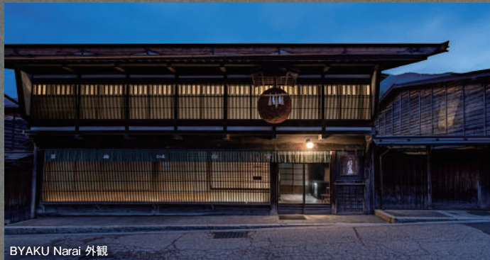
BYAKU Narai 外観