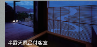
半露天風呂付客室