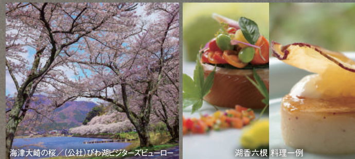
海津大崎の桜

「日本さくら名所100選」海津大崎の景色を船上からと陸上から満喫。昼食は、近江商人発祥の地・五箇荘にある料亭「湖香六根」。湖の恵みや地場産食材を活かした、六根に沁みる特別な時間をお届けします。