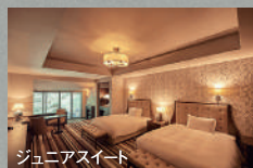
ジュニアスイート

お食事:〈夕食〉フレンチフルコース(レストラン) 〈朝食〉洋食ビュッフェ(レストラン)