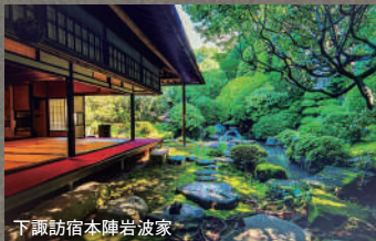
下諏訪宿本陣岩波家