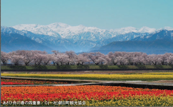
あさひ舟川春の四重奏

標高3,000m級の北アルプスの山々と水深1,000mを超える富山湾、この世界でもまれにみる急峻な地形が独特な景観と魚介の宝庫といわれる海の幸を生み出します。「あさひ舟川春の四重奏」の、残雪の北アルプスを背景に桜並木、チューリップ、菜の花が重なり合って奏でる景色は、この場所・この時期だけしか見られない、まさに奇跡の絶景です。お泊りは皇族や著名な文化人にも愛された伝統ある温泉旅館「延楽」。夕食は毎日の仕入れの最高の食材でその日に献立を組む「雅膳」でおもてないたします。