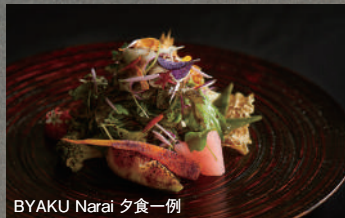
BYAKU Narai 夕食一例