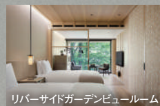
リバーサイドガーデンビュールーム

※ガストロノミーレストラン「レックハウス」での 夕食をご希望の場合は予約時にご相談ください。