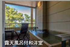
露天風呂付和洋室

お食事:湯宿館(夕食)和会席(お部屋食) (朝食)和朝食(お部屋食) 華水館(夕食)和会席(食事処) (朝食)和朝食(食事処)