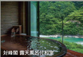
対峰閣 露天風呂付和室

お部屋:対峰閣和室(12.5畳) 対峰閣露天風呂付和室(12.5畳) お風呂:大浴場・露天風呂 お食事:(夕食)和会席(宴会場) (朝食)和朝食(宴会場)